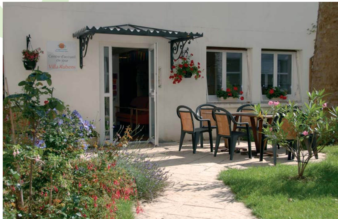
Centre d'accueil de jour thérapeutique d'une capacité de 10 places

La « Villa Rubens » intégrée à l'établissement « Péan » permet d'accueillir des personnes âgées de plus de 60 ans atteintes de la maladie d'Alzheimer (ou de troubles apparentés). L'accueil de jour est un service complémentaire à un projet de maintien à domicile. La pratique d'activités thérapeutiques telles que la gym douce, l'art-thérapie, les ateliers mémoire, les stimulations sensorielles et cognitives... permettent de préserver l'autonomie et la liberté de chacun pour un plein épanouissement.